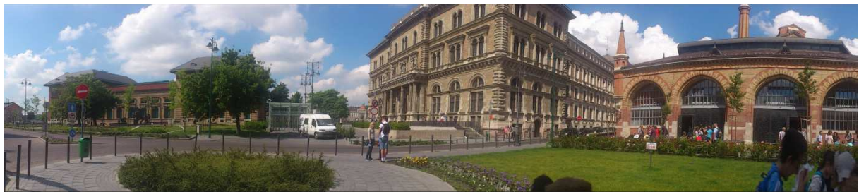
Egyetemet választunk magunknak